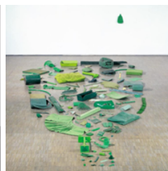
4. Tony Cragg, Sans titre (Bouteille verte) , 1980 plus d'informations ici