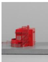
1. Bernard Tschumi, Parc de la Villette : maquette de rendu 1983 - 1992 plus d'informations ici