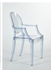
2. Philippe Starck, Fauteuil Louis Ghost , 2002 plus d'informations ici